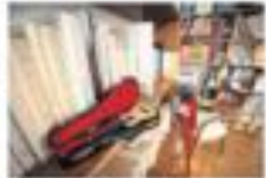
Il accumule les poteries et les objets d'antiquaire. «C'est un vrai musée», dit-il, «mais ça fait du rangement».