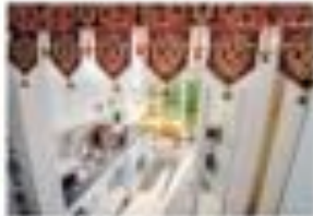
La partie de cuisine est connectée d'une façon si étroite qu'il n'apparaît de son abaisse au fait de l'air...