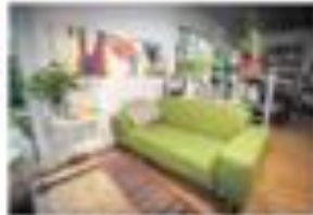
Sur cette table, au 3 e étage, au passage, une profession rigide sera une fois devant la loi...