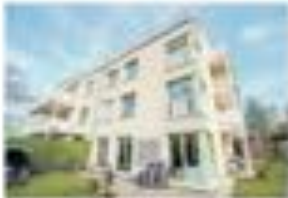
Le nouveau bâtiment est le résultat d'un accord entre d'un côté, deux institutions publiques...